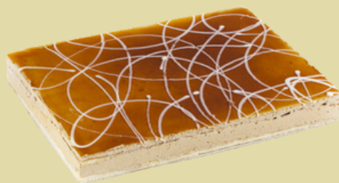
Dulce de leche