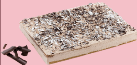
Tarta de chocolate