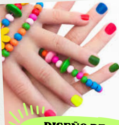
DISEÑO DE UÑAS