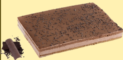
Tarta bombón (tipo mousse)